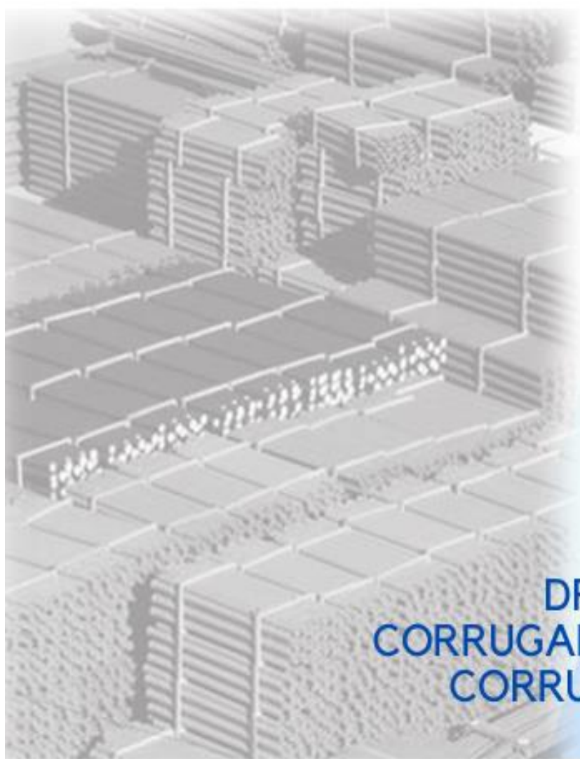
TABELA N° 1

TUBOS PVC DRENAGEM CORRUGADOS SANEAMENTO CORRUGADO CABOS